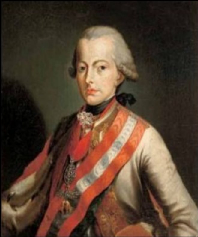
Ritratto di Giuseppe II d'Austria