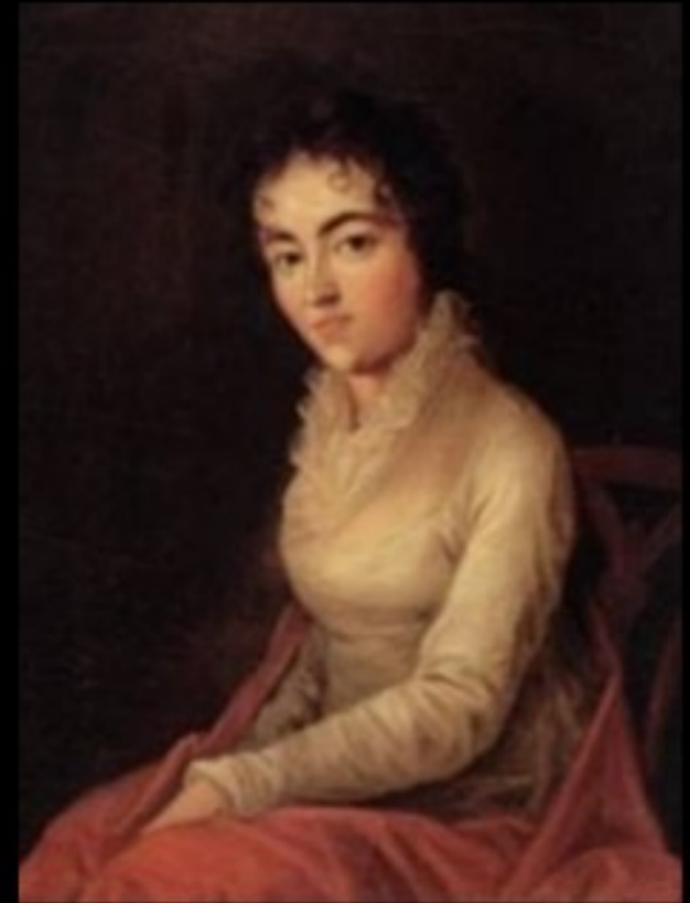
Ritratto di Costanze Weber, moglie di Mozart