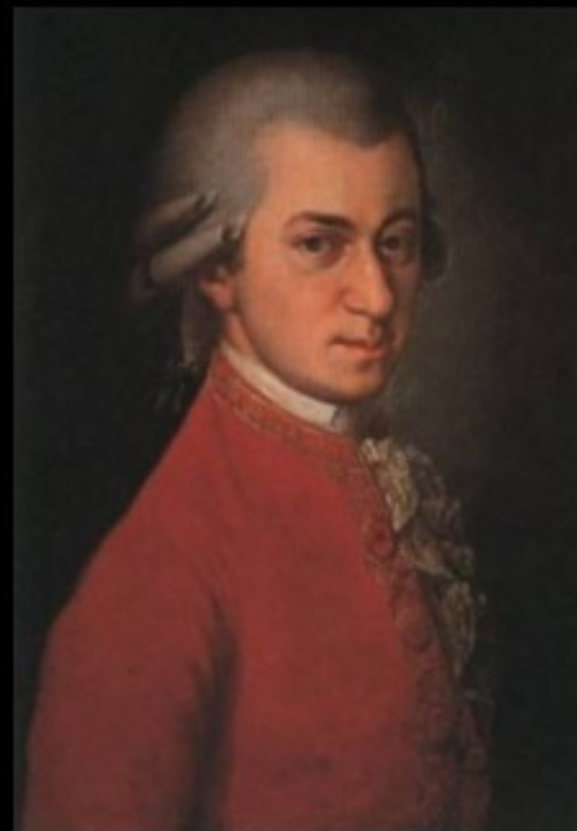
Ritratto di Wolfgang Amadeus Mozart