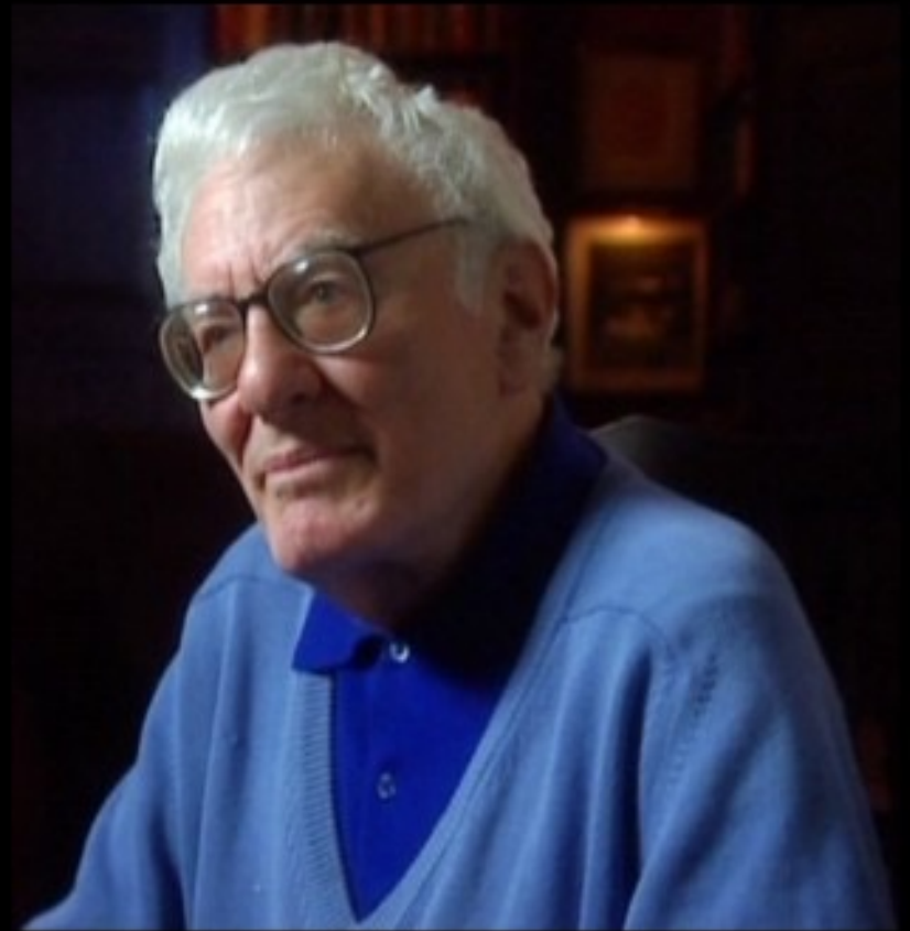
Il commediografo Peter Shaffer