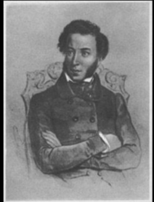
Ritratto del drammaturgo Alexander Puskin