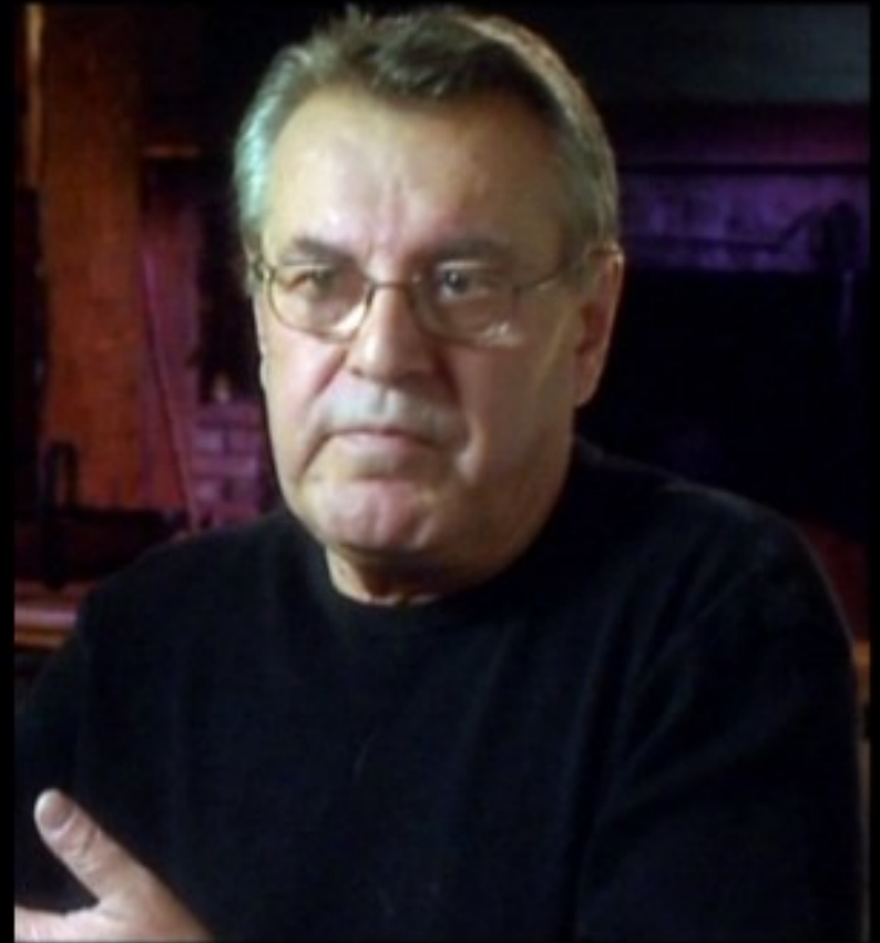
Il regista Milos Forman