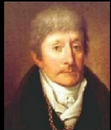
Ritratto di Antonio Salieri